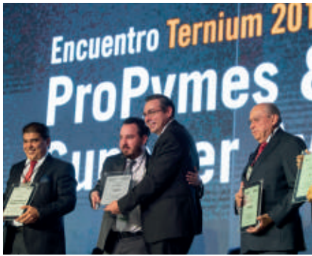
Encuentro Ternium ProPymes.