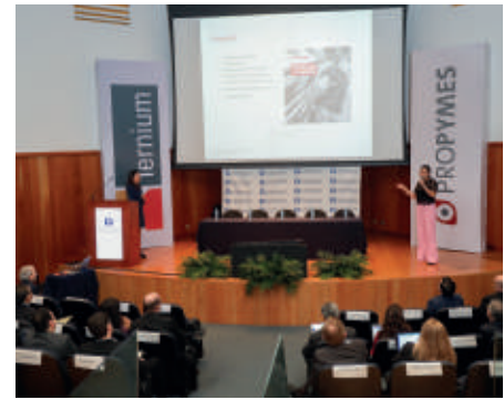
Transferencia de aprendizajes: aprovechamiento de las mejores prácticas de gestión de negocio y acceso a los mejores avances en tecnología.

Desde 2015 hemos diseñado un encuentro para reunir a los más de 1000 empresarios que han participado en el programa ProPymes desde sus inicios, con el objetivo de realizar un balance de actividades del programa, así como compartir experiencias, casos de éxito, aprendizajes, objetivos por delante y hacer un reconocimiento a los empresarios Pymes para seguir incentivando el desarrollo de un tejido industrial mexicano competitivo.