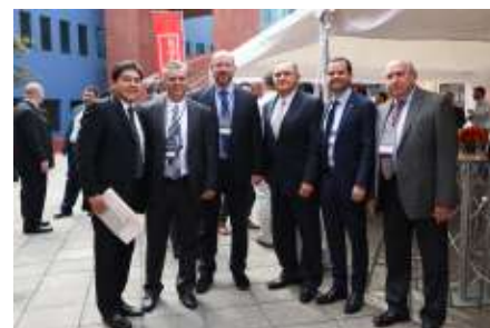
ProPymes lanza un programa de desarrollo de competencias para el personal de Pymes clientes y proveedoras de Ternium en todos los niveles, con apoyo de instituciones educativas.