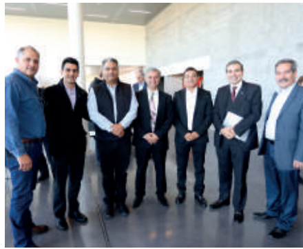
Vínculo comercial: fortalecer la relación de fidelidad y lealtad hacia y/o desde clientes y proveedores.