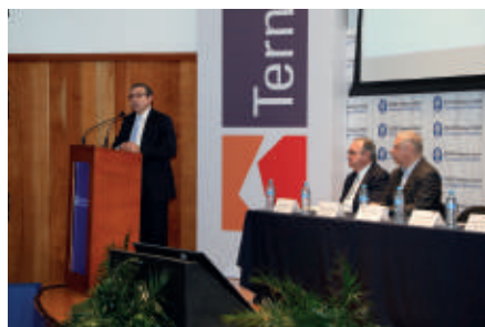
Gobierno: Programa de Empresas Eje.