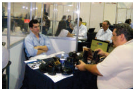
Cámaras: Semana Regional Pyme y Cámara de la Industria de la Transformación de Nuevo León (CAINTRA).

ProPymes tiene como objetivo el fortalecimiento de la cadena de valor, contribuyendo así al desarrollo del tejido industrial mexicano a través de puntos específicos.